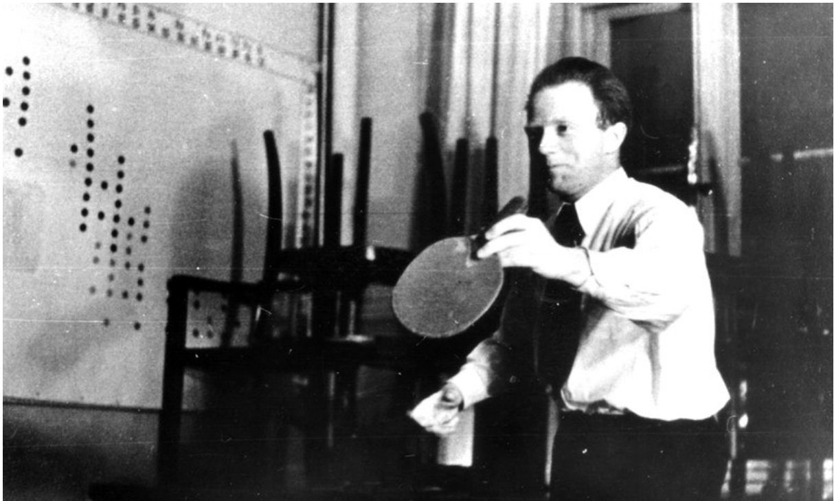
Der Physiker Werner Heisenberg beim Tischtennis in der Linnéstraße 5.